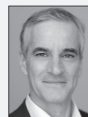
Jonas Gahr Støre